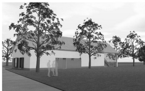
ANYAG ÉS SZÍNHASZNÁLAT: A TEMPLOMMAL HARMÓNIÁBAN FEHÉR ÉS VILÁGOS HÍDEGSZÜRKE SZÍNEK A HOMLOKZATON NATUR KERÁMIA TETŐFEZÉS

A meglévő alkalmaink, közösségeink mellé szervezhetünk magunknak újakat is. Évek óta gondolkodom rajta, hogy milyen formában lehetne összehozni az idősebb korosztályt is egy vagy több közösségbe. Máshol láttam, hogy van pl. asszonykör, ahol ez a korosztály képviselteti magát, és olyan programokat szerveznek, ami őket érdekli. A nyári lelki gyakorlatunkon Kornél atyának volt egy megjegyzése, ami engem nagyon szíven ütött: más egyházközségekben sem az atyák szervezik ezeket a programokat, alkalmakat, hanem a vállalkozó kedvű gyülekezeti tagok. Azóta is sokszor eszembe jut, hogy mernünk kell bátornak lenni, és ha eszünkbe jut egy jó ötlet, próbáljuk megvalósítani. Lehet, hogy néhányszor