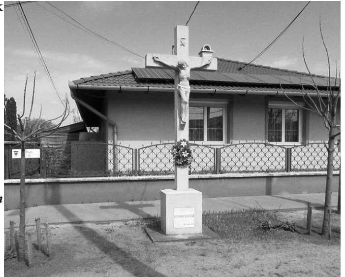
Pesti út (Hatháza)