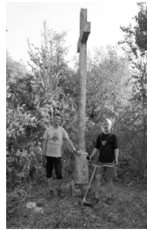
Az elveszettnek hitt kilencedik kereszt