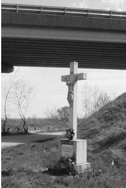
Sportliget lakóparki felüljáró