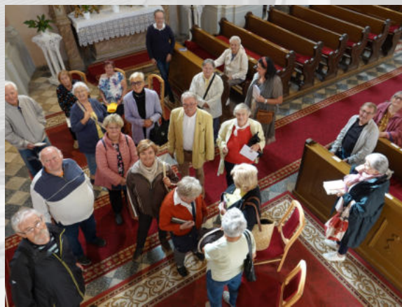
A nyugdíjas klub tagjai ismerkednek templomunkkal