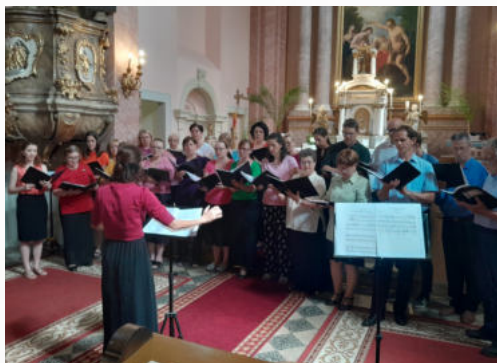
Énekkarunk a templombúcsú ünnepén