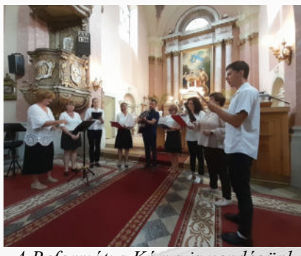
A Református Kórus is vendégünk volt a kórustalálkozón