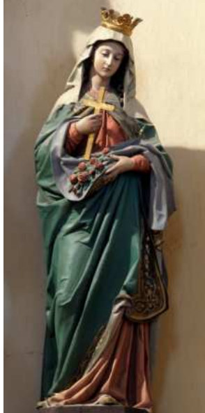
Szent Erzsébet szobra templomunkban

Ha megkérdezzük az embereket, akár idehaza, akár a nagyvilágban, hogy ki a leghíresebb magyar, a többség rögtön rávágja: Puskás. Tény, Puskás Ferenc nevét szinte az egész világon ismerik, és tudják a XX. század egyik legjobb labdarúgójáról, akinek szobrot is állítottak Spanyolországtól Ausztráliáig, hogy magyar volt. Sokan még Rubik Ernőt is emlegetnék, hisz a Rubik-kockával is játszanak világszerte, amivel még világbajnokságot is rendeznek. Ezekre magyarként mind büszkék lehetünk.