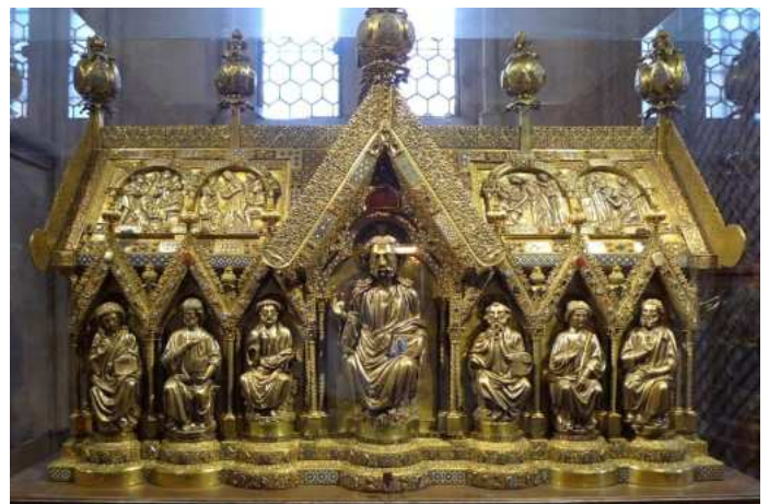
Szent Erzsébet sírja

Így amikor a Szent Erzsébet himnusszal énekeljük,