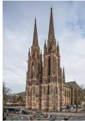
A marburgi Szent Erzsébet templom

legismertebb története, amikor a szegényeknek vitt kenyeret, és sógora kérdésére, tartva annak feddésétől, azt mondta, rózsák vannak nála. Amikor megmutatta, a kenyerek rózsákká változtak. Innen ered, hogy Erzsébetet szobrokon, festményeken mindig rózsával ábrázolják. Az Európát behálózó katolikus templomok sokaságában találkozhatunk Szent Erzsébettel, akit az angol, az olasz és a spanyol nyelvterületeken is „magyarországi Szent Erzsébetként” tartanak számon (Elisabeth of Hungary, Santa Isabel de Hungría, Elisabetta d'Ungheria).